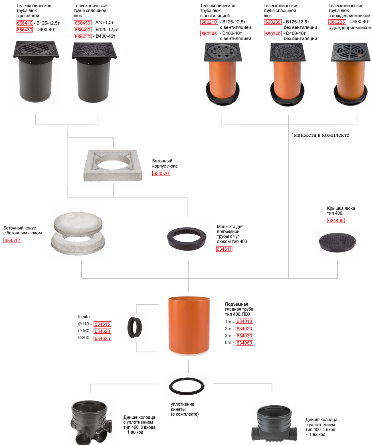
Схема подбора конструкции колодца тип 400