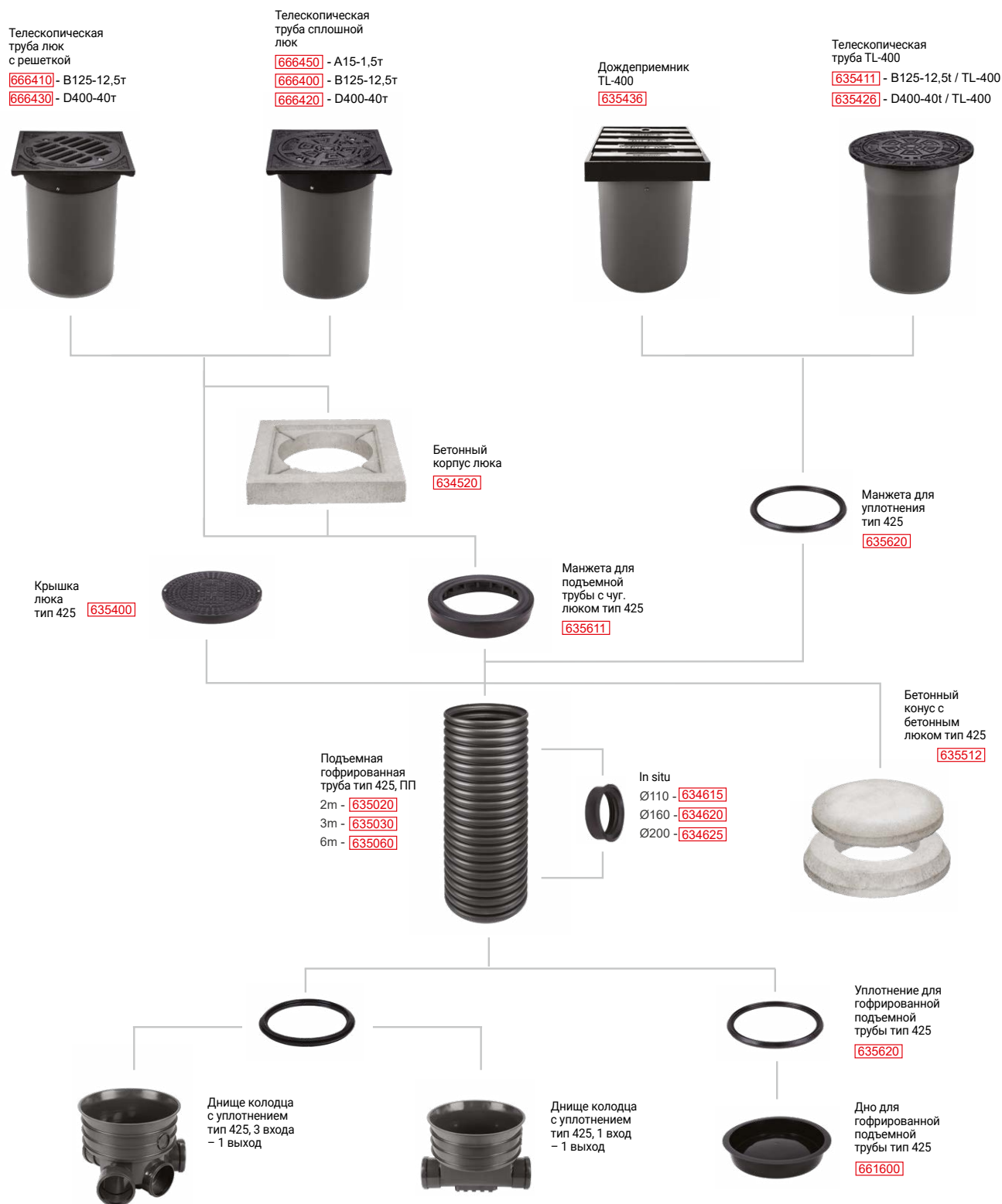
Схема подбора конструкции колодца тип 425